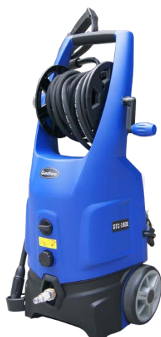
型号 : GTC-160E

有效的清洗能力和经济性, 使其能够广泛地应用到各个行业, 适用于生产车间、酒店物业的日常保洁和汽车及机械设备快速的清洗。